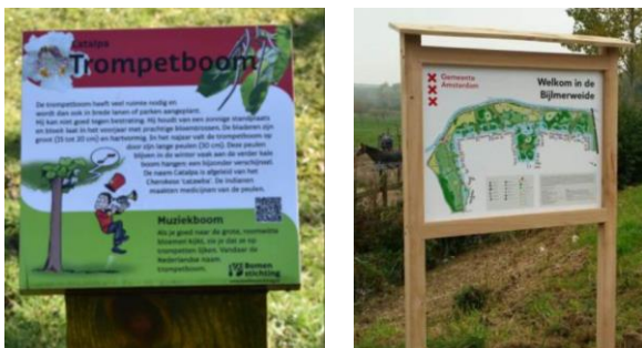
Figuur 2 Voorbeeld kleine en grote informatieborden 2

Het plaatsen van informatieborden is opgesplitst in het aanbrengen van kleine en grote houten informatieborden (zie Figuur 2) en het plaatsen van het beeld van een koe. Er is per maatregel nog niet bepaald wat voor informatieborden er moeten komen en hoeveel, dus de prijs is per bord aangegeven voor zowel kleine als grote borden. Het plaatsen van een kunstwerk op 50 meter afstand van een ingang helpt de recreant in het visualiseren wat de 50 meter afstand tot een grazer is. De prijzen zijn gebaseerd op prijzen op de markt. De kosten in de raming zijn per informatiebord.